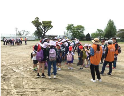
各班でミッションを確認

ボランティアのみなさんには、子どもたちの安全確保のため、いっしょに歩いていただき、チェックポイントに立っていただいたりしました。おかげさまで交通事故や大きな事故なく、無事、楽しい遠足となりました。本当にありがとうございました。