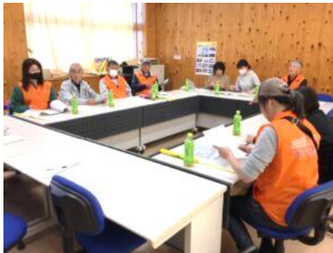
打ち合わせの様子

スクールガードのみなさんと打ち合わせをした後、子どもたちと顔合わせを行いました。毎日、交差点やふみきりなど危険な所で見守ったり、子どもたちといっしょに登校したりと、安全確保に努めていただき、ありがとうございます。また、学校の安全管理にもご協力いただき、感謝しています。子どもたちも、「感謝の言葉と、これからもよろしく願います」の思いを伝えました。これから、暑い日も続きますが、地域の子どもの健全な成長をいっしょに見守っていただけると幸いです。よろしく願います。