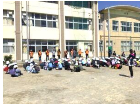
子どもたちとの顔合わせの様子