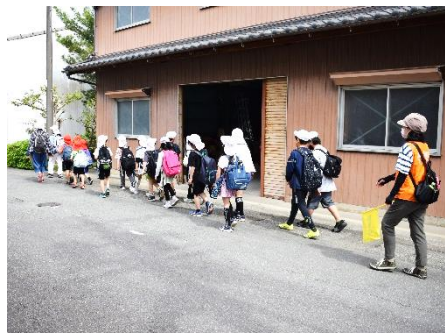
ゴールをめざして豊田地区を歩く