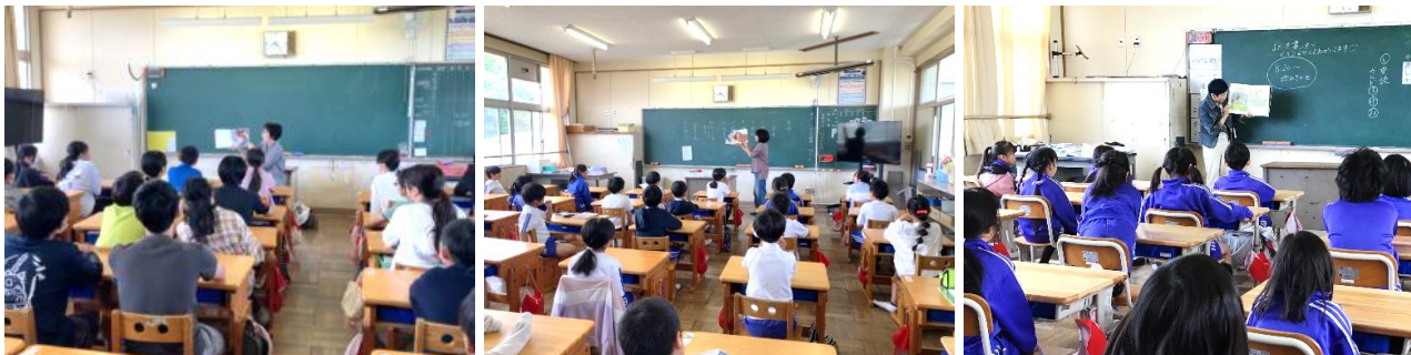
朝から絵本の楽しさを！ よみきかせの後に大きな拍手！ じっと本を見つめ 声を聞いて

今年度初めてボランティアさんによる「朝のよみきかせ」をしていただきました。8日は、3～6年生に、9日は、1・2年に、未来の世界のお話やおみそ汁のお話などの絵本を読んでいただきました。静かに耳を傾ける学年や楽しく会話をしながら聞く学年など、心の栄養をたくさんいただきました。ありがとうございました。